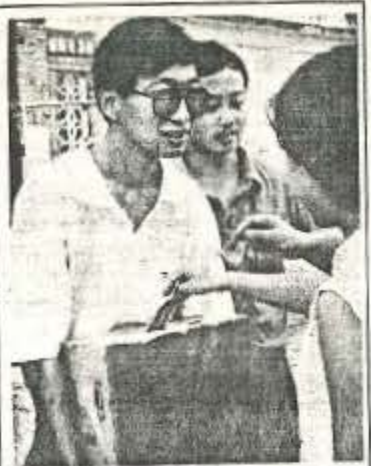
羊城晚报 一九九一年九月十八日 此图显示，来自安徽灾区的暨南大 学学生，每当谈及安徽灾区的所见 所闻，神情总是那么凝重。灾区的民 众对我们的帮助，在学校更起的为灾民人 民募捐活动当中，他是那么积极的一面。 右图：