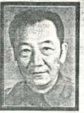
本報訊 中共廣東省委黨史領導小組顧問、原中央廣東省顧問委員會副主任、原副省長楊康華同志，因病搶救無效，

不幸於一九九一年十月三十一日上午八時三十分在廣州逝世，終年七十七歲。 楊康華同志，原名盧煥章，祖籍浙江省會稽，一九一五年一月生于廣州。一九三五年參加革命工作。一九三六年三月加入中國共產黨。楊康華同志自學生時代起就熱切追求進步思想，積極投身革命運動，先後發起組織了「中山大學文藝研究會」，「馬列主義行動團」等學生進步團體。一九三五年十二月，他參與發起廣州學生為響應北京「一二·九運動」而舉行的抗日救亡遊行示威。一九三八年一月起，他先後任中共廣州市委常委、宣傳部長，東南特委宣傳部長，香港市委書記。一九四二年一月後任廣東人民抗日游擊總隊副政委兼政治部主任，東江縱隊政治部主任，為東江縱隊的創立和發展作出了重要貢獻。一九四五年七月，當選為中共廣東區黨委委員。同年八月，任粵北黨政軍委員會書記。北撤山東後，任華東軍政大學第五大隊政