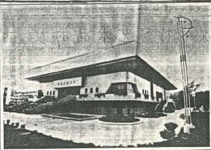
羊城晚報 1991. 12. 8.