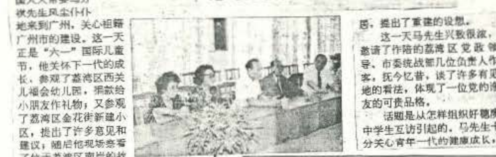
馬先生（左四）與學生流市長在一次參觀活動中。

6月的廣州，火紅的太陽灼人，澳門中華總商會會長、全國人大常委馬萬祺先生风尘仆仆地來到廣州，關心祖籍廣州市的建設。這一天正是「六一」國際兒童節，他關懷下一代的成長，參觀了荔湾区西關兒童福利院，捐款給小朋友作禮物；又參觀了荔湾区金花街新建小區，提出了許多意見和建議；隨後他現場簽署了位於荔湾区南岸的故積極倡導組織兩地中學生互訪，以增長青年人的見聞和愛國主義感情。這去年馬先生出資組織兩地中學生互訪之後，今年7月間再次組織這種互訪。馬先生說：要幫助青年人了解中國近代史，學會結合中國國情考慮問題，不要盲目學西方。中國歷史證明，要想國家富強，人民幸福，必須由共產黨來領導，「沒有共產黨就沒有新中國」這是歷史的結論。馬先生認為，江總書記寫信給教委會主任，提出加強對青少年的國情教育，十分重要。要讓青少年了解中國過去的情況，舊中國飽經滄桑，受人欺侮，任人宰割，帝國主義列強從我國搶走了多少金錢財寶，發達的資本主義國家就是大量掠奪了殖民地的財富以高經過二三十年發展起來的，祖國大陸在共產黨領導下搞建設才四十年，目前落後于人是不可避免的，但是只要堅持改革開放，集中力量搞建設，將來一定會富強起來，我對此充滿信心。